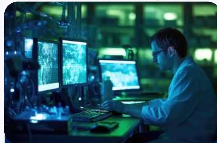
Como a IA realmente é

Utilizar dados coletados nas plataformas para segmentar o público e personalizar ofertas e comunicações.