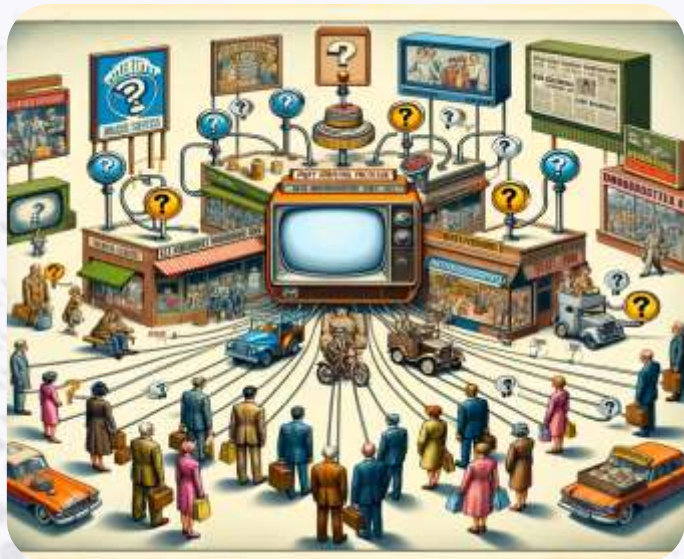
Era Industrial - Broadcasting de Produto