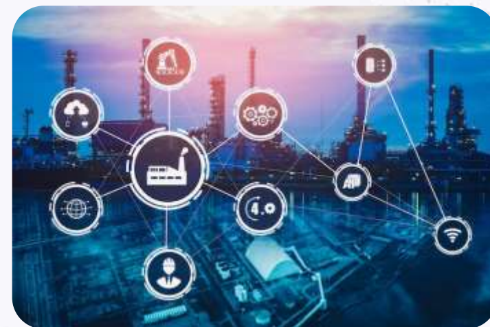
Produto ou Serviço resolve que Problema?