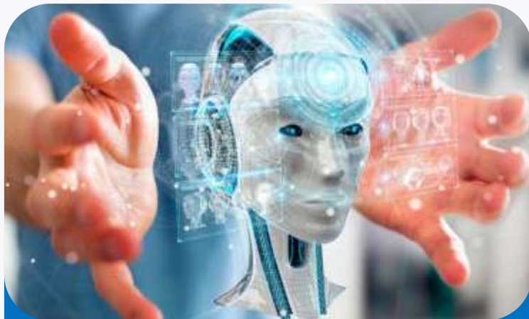
Como as pessoas Vêem a IA